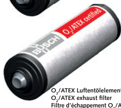
O 2 /ATEX Luftentölelement O 2 /ATEX exhaust filter Filtre d'échappement O 2 /ATEX

Original Busch Luftentölelemente sind als Standardversion grundsätzlich bei allen industriellen Anwendungen die beste Lösung. Außerdem stehen Luftentölelemente zur Verfügung, die für das Fördern von Sauerstoff und brennbarer Gase entwickelt wurden. Diese Luftentölelemente sind nach den ATEX-Richtlinien zertifiziert, bzw. verfügen über die Zulassung zur Förderung von Gasen mit angereichertem Sauerstoffgehalt.