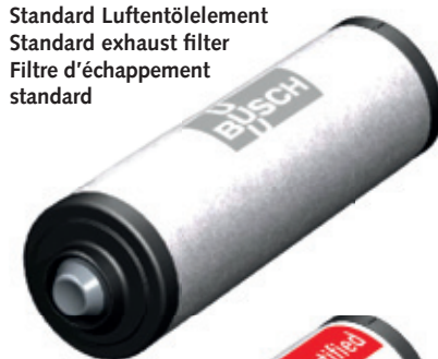
Standard Luftentölelement Standard exhaust filter Filtre d'échappement standard

Résistance chimique élevée pour la plupart des produits chimiques (solvants, essence, acides, bases, etc.). Donc utilisables dans presque toutes les applications.